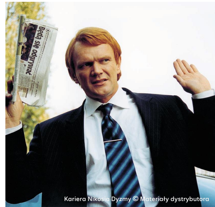
Kariera Nikosia Dyzmy