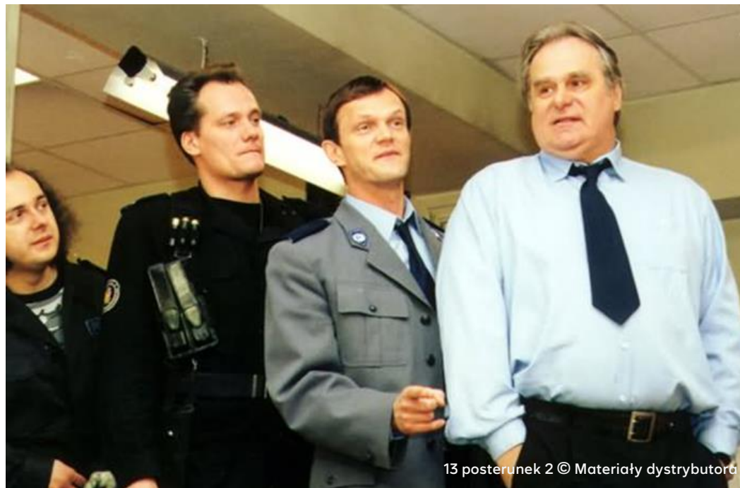
13 posterunek 2