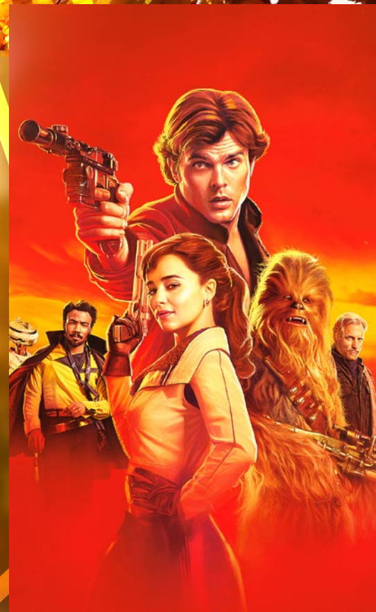
Han Solo: Gwiezdne wojny - historie